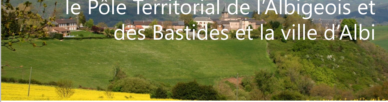
Village de St André (CC Monts d'Alban)