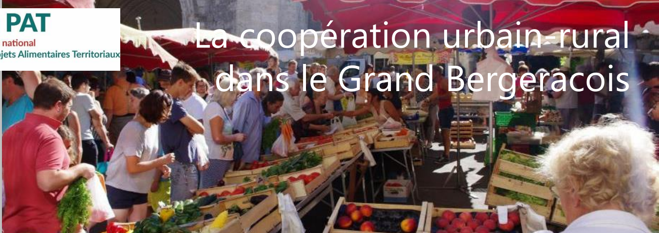
Marché d'Issigeac (CC Portes Sud Périgord)