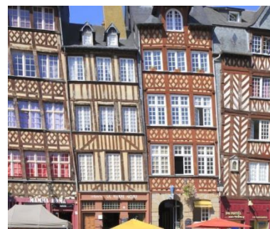
Maisons à pans-de-bois (Vieux Rennes)