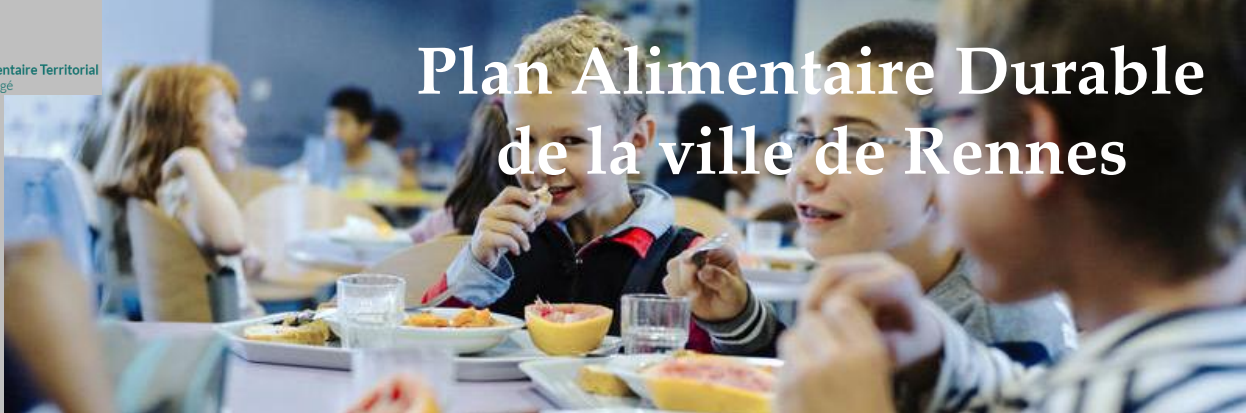
Déjeuner en restauration scolaire (Rennes)