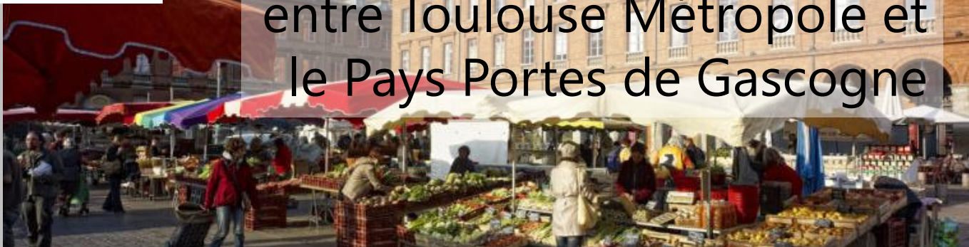
Marché Bio de L'Esparcette (Toulouse)