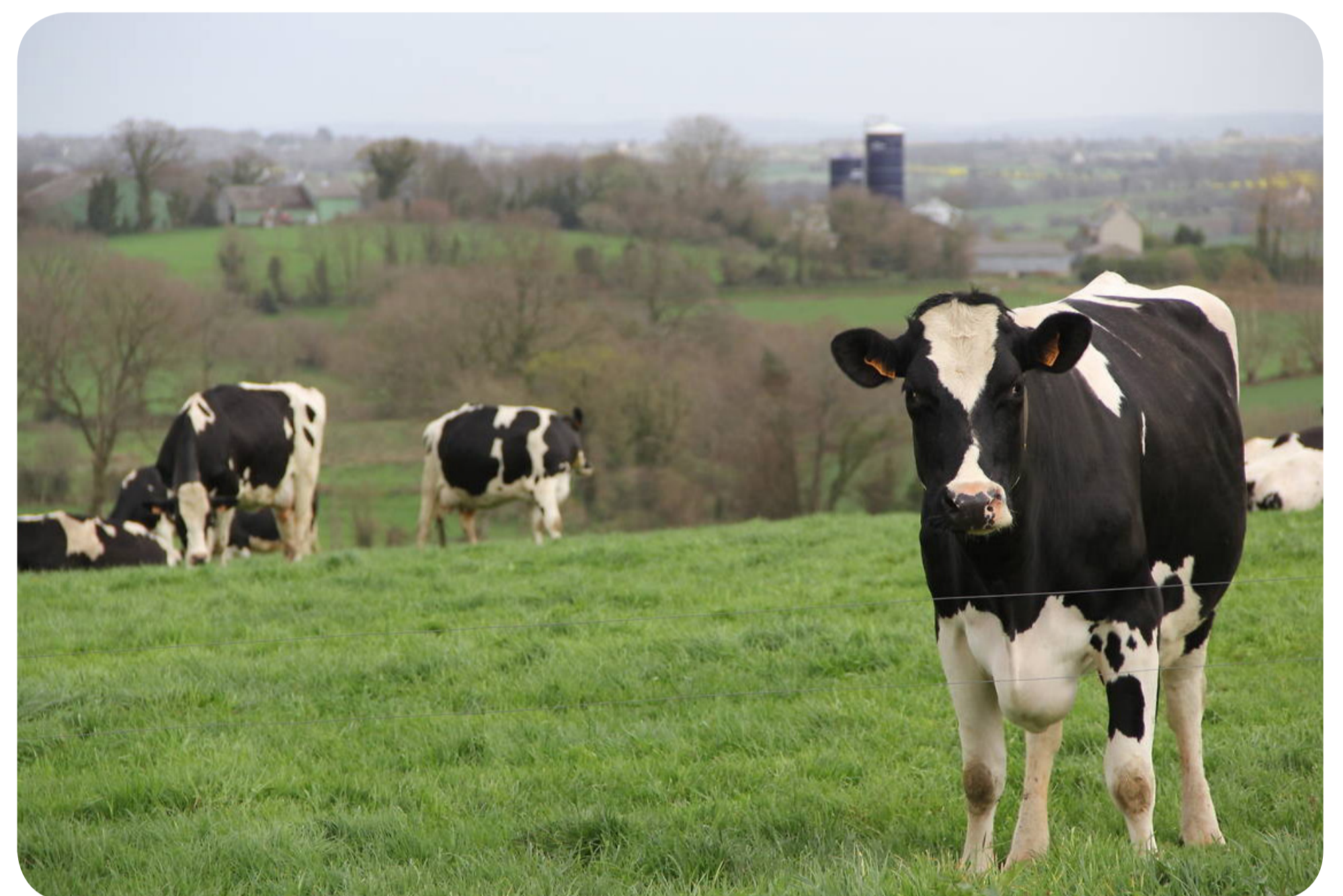
Vaches laitières en Bretagne